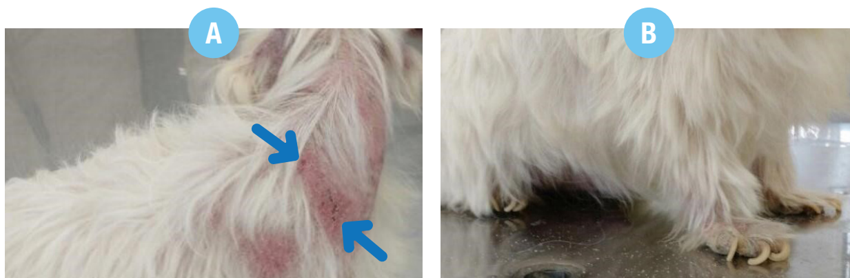
Figura 1 - Cão com diagnóstico de leishmaniose visceral apresentando: A - Área de hipotricose em região cérvico-torácica, com presença de eritema, e crostas hemáticas (setas); B - Unhas compridas (onicogribose), hipotricose em patas anteriores, além de escamas furfuráceas visíveis na mesa de consulta oriunda da descamação generalizada apresentada pelo animal.

Relativamente ao aspecto clínico, a LVC pode se manifestar com um amplo espectro de apresentações e em diferentes graus de gravidade, não havendo sinais considerados específicos ou patognomônicos da enfermidade. Dessa forma, podem ocorrer alterações clínicas relacionadas à qualquer órgão ou sistema, como o cardiorrespiratório, circulatório, digestório, geniturinário, locomotor, oftálmico, nervoso e, particularmente, o tegumentar, sendo as manifestações clínicas mais comumente observadas no cão doente: alopecia (Figura 1A), disqueratinização (Figura 1B), dermatite erodo-ulcerativa e/ou pápulo-nódulo-pustular, hiperqueratose nasodigital, onicogribose (Figura 1B), dentre outras alterações cutâneas; linfadenomegalia, hepatoesplenomegalia; emagrecimento progressivo, inapetência ou polifagia, diarreia; mucosas pálidas, letargia; poliúria, polidipsia, êmese; blefarite, ceratoconjuntivite, uveíte, endoftalmite; vasculite, quadros hemorrágicos, epistaxe, distúrbios de coagulação; artrite/poliartrite, osteomielite, polimiosite, atrofia muscular; e menos comuns, incluem-se manifestações neurológicas variadas, dentre outras.